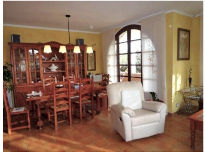
Large dining room