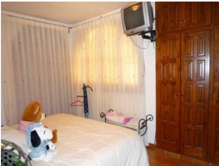
One of the 4 bedrooms