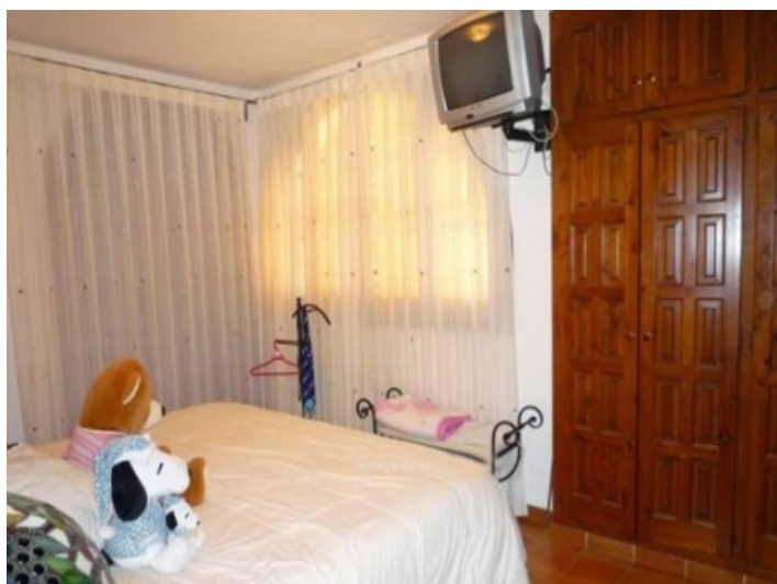
One of the 4 bedrooms