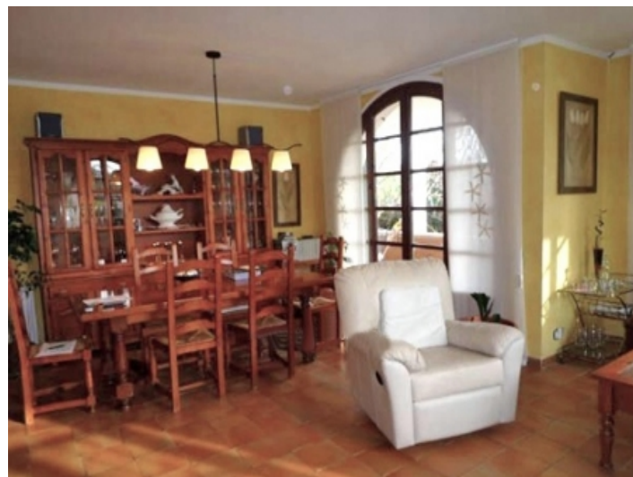
Large dining room