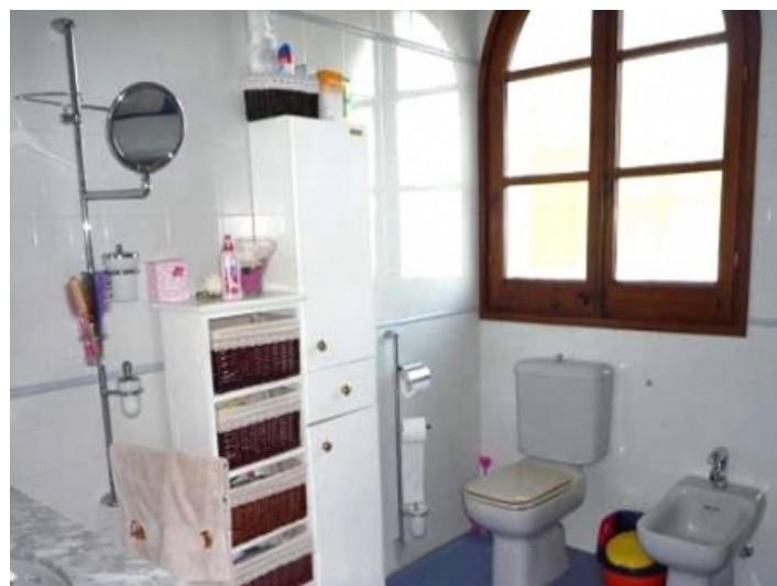
One of the 2 bathrooms

Alle Angaben nach bestem Wissen. Irrtum und Zwischenverkauf vorbehalten. Dieses Exposé ist eine Vorinformation, als Rechtsgrundlage gilt allein der notariell abgeschlossene Kaufvertrag.