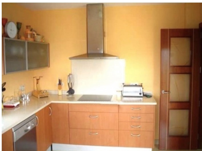
Modern fitted kitchen