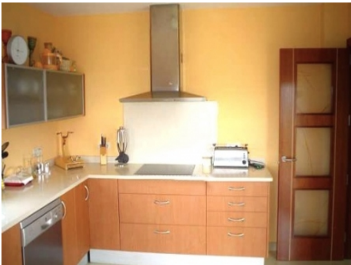
Modern fitted kitchen