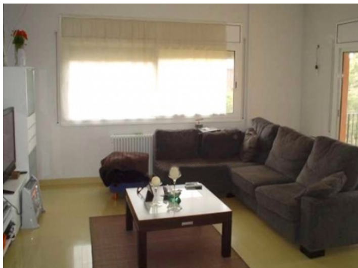
Bright living room