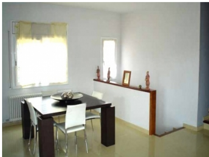
Classy dining room