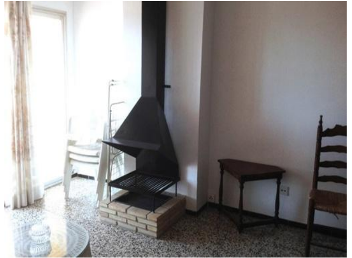
Kamin für angenehme Temperaturen im Winter