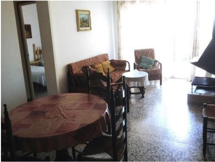
Wohnzimmer mit Essbereich