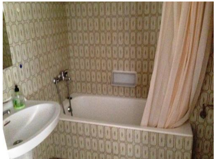
Gemütliches Badezimmer mit Badewanne